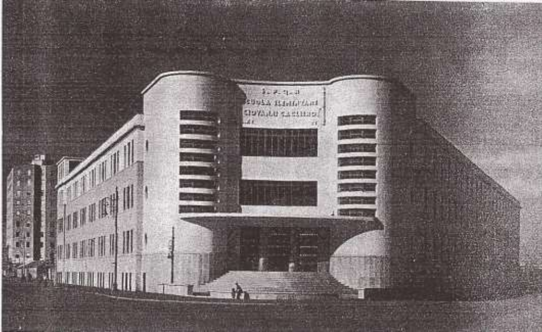
Foto della scuola Cagliari pochi giorni prima della sua inaugurazione. Notare che aveva solo due piani, sulla facciata il nome della scuola era affiancato dai Fasci Littori, notare – sulla sinistra – il cosiddetto “Palazzone” unico edificio di via delle Cave, oggi al civico 91. Notare i pali dell’illuminazione pubblica.