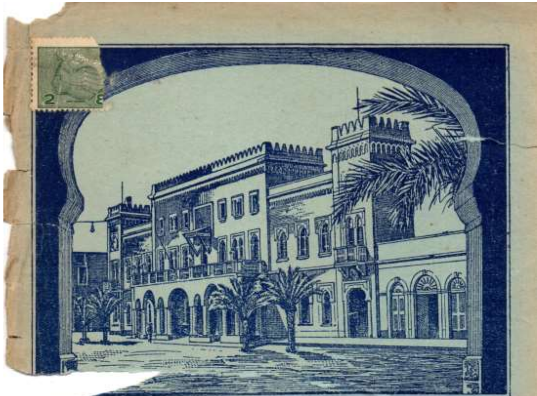
BENGASI (Cirenaica) • Palazzo Municipale.