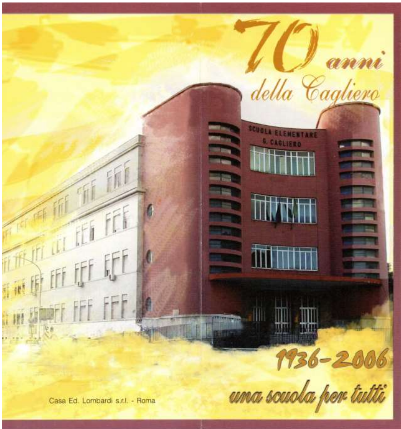
Locandina per i 70 anni della Cagliero (2006), in quell'occasione venne realizzato un primo museo della scuola.