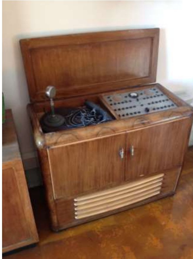
Apparecchio radio che serviva al direttore didattico per comunicare con tutte le aule, ancora funzionava il 9 maggio 1978 quando venne data notizia del ritrovamento del corpo di Aldo Moro.