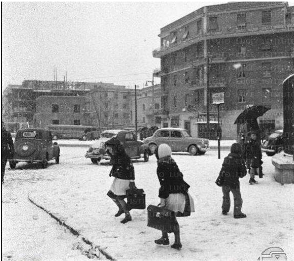
La famosa nevicata del 1956, siamo di fronte alla scuola.