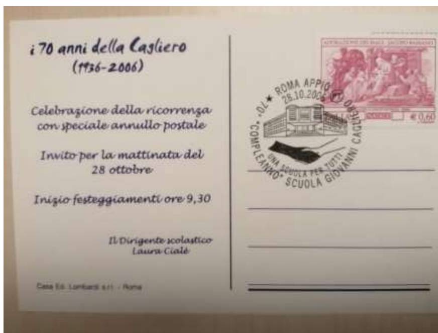
Annullo speciale delle Poste Italiane per la Cartolina del 70° Cagliero.