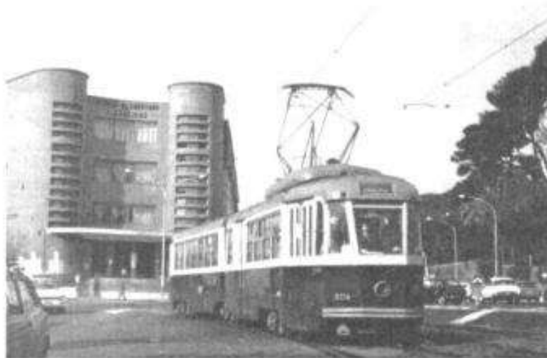
Dal 1937 al 1980 un tram, diretto a Cinecittà, passava davanti alla Cagliero.