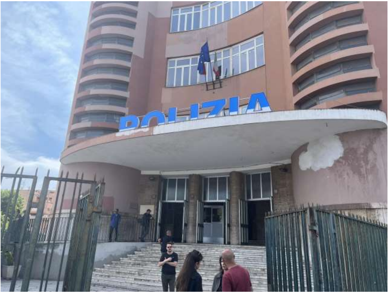
La scuola Cagliero nell'estate del 2023, è diventata sede della Polizia di Napoli per riprese cinematografiche.